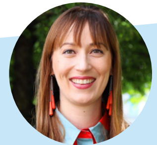
Eveliina Heinäluoma Kansanedustaja, SDP Puheenjohtaja, Etelä-Suomen Klubitalot ESKOT ry

Klubitalot tarjoavat tärkeän yhteisön, joka auttaa työelämään tai opintoihin palaamisessa. Jokainen on arvokas, myös työelämässä.”